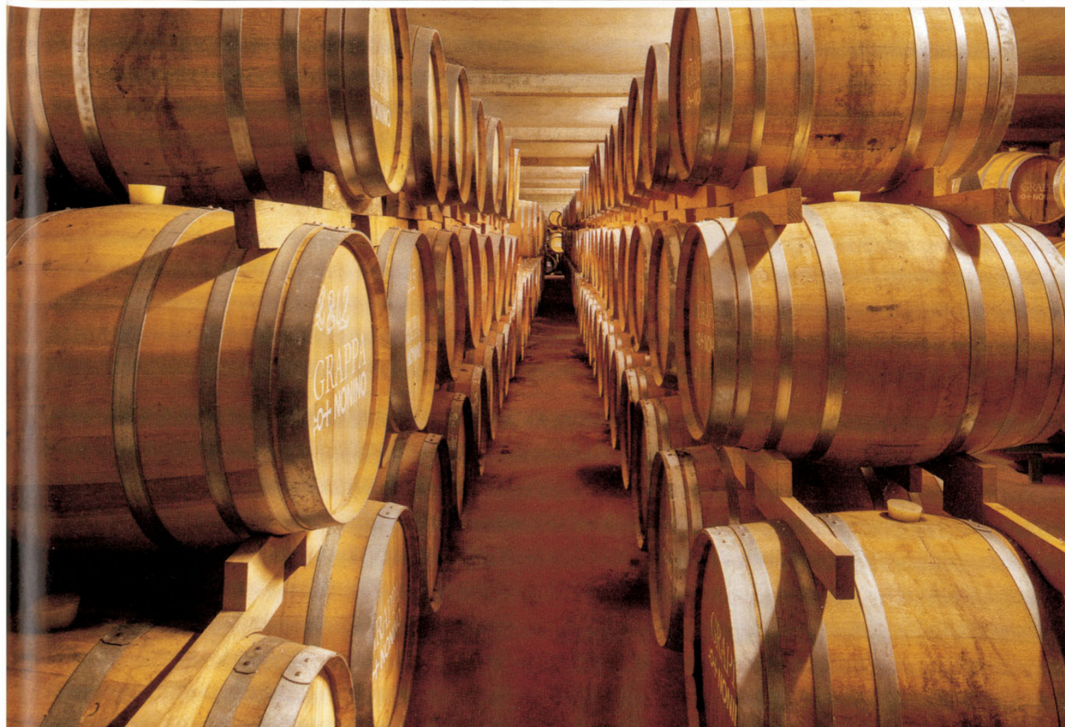
In alto, la Grappa Monovitigno Picolit e la Grappa Riserva 8 anni. Nella pagina accanto, in alto, un momento della distillazione; in basso, la cantina con le botti di legni pregiati. Above, Grappa Monovitigno Picolit and Grappa Riserva 8 years. In the right page, a phase of the distillation and the winery.