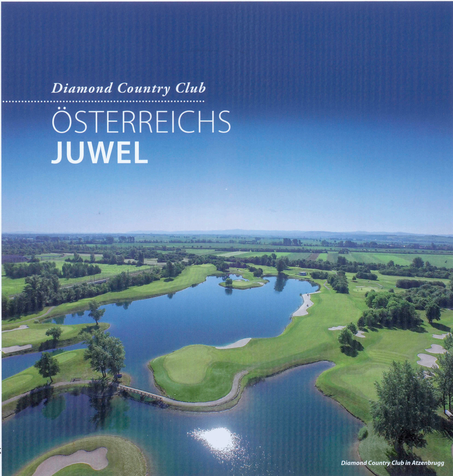
Diamond Country Club in Atzenbrugg