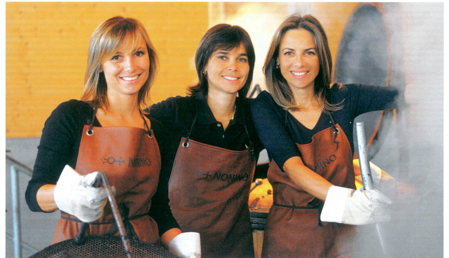
Die drei Nonino Schwestern