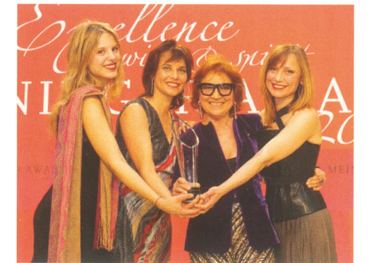
Spirituosenunternehmer des Jahres

1976 gründete der gebürtige Belgier mit 30 Jahren sein eigenes Unternehmen und produzierte den ersten Champagner der Marke Vranken. Ein Meilenstein für die Entwicklung seiner Gruppe war 2002 die Übernahme des renommierten Champagnerhauses Pommery. Mit knapp 300 Millionen Euro Jahresumsatz gehört Vranken-Pommery heute zu den führenden Champagnergruppen und zugleich zu den zehn größten Weinproduzenten Frankreichs.