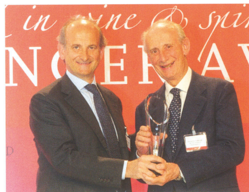
Weinfamilie des Jahres