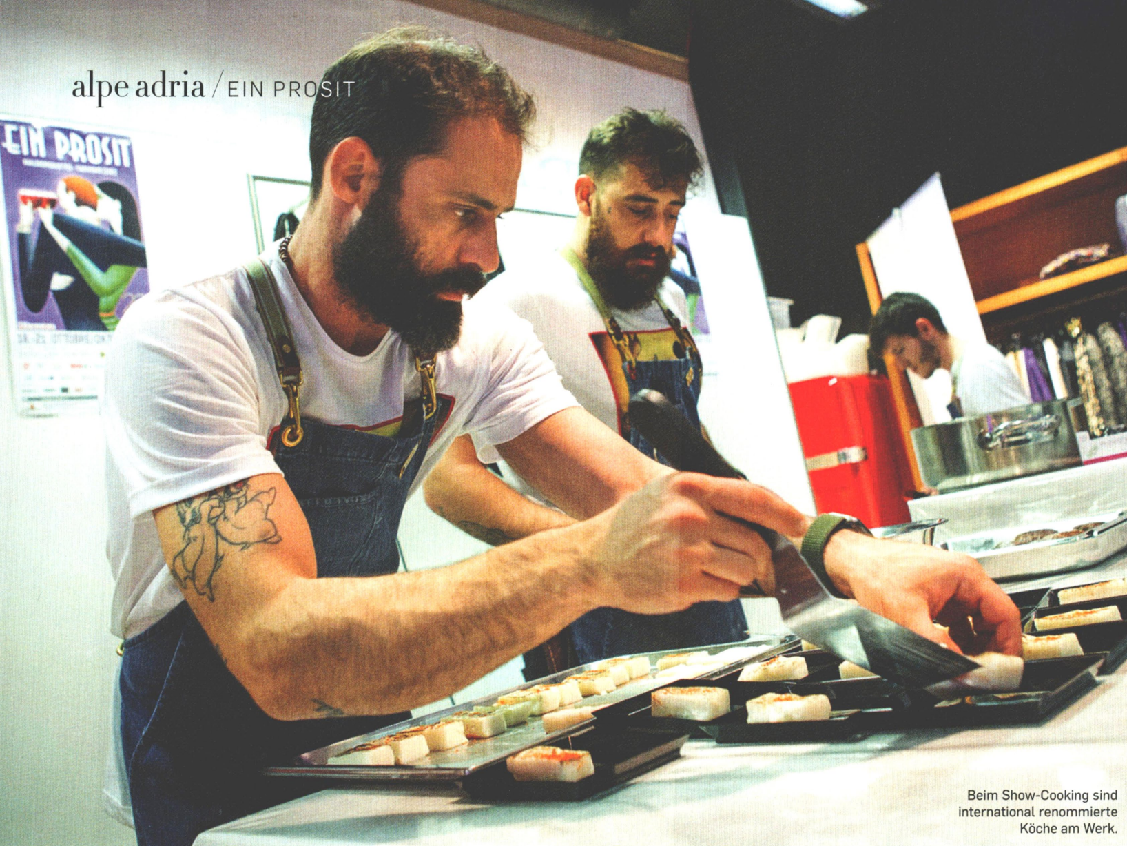
Beim Show-Cooking sind international renommierte Köche am Werk.