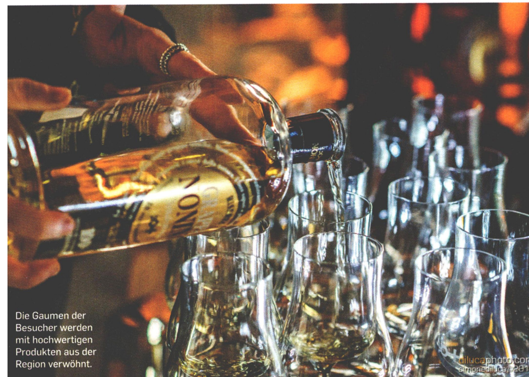
Die Gaumen der Besucher werden mit hochwertigen Produkten aus der Region verwöhnt.

rund 150 ausstellenden Winzern und landwirtschaftlichen Betrieben lässt sich somit ausgiebig entdecken, schmecken und kommentieren. Im Bereich Culinaria warten dabei gastronomische Spezialitäten darauf, verkostet zu werden, während im Bereich Vigneto die verschiedensten edlen Tropfen ausgeschenkt werden. Passend dazu sorgen insgesamt rund 40 von Weinexperten geführte Verkostungen für einen wissenswerten Einblick rund um die Geschichte, die Eigenschaften und die Besonderheiten der vorgestellten Weine. Vom kleinen Hersteller bis zu großen Flaschen, die die