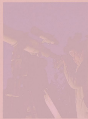
Telescopio Fino a fine febbraio

Sei pianeti visibili in un solo colpo d'occhio, dalla finestra di casa. È quanto si può fare in queste sere alzando lo sguardo al cielo per ammirare l'insolita sfilata inscenata da Venere, Saturno, Giove, Marte, Urano e Nettuno. La parata planetaria è una cosa ben diversa dall'allineamento di pianeti, andrà avanti per diverse settimane e a fine febbraio sarà completata da Mercurio. Meteo permettendo, lo spettacolo inizia alle ore 18: puntando gli occhi verso ovest «si riconosce subito la luminosissima Venere, l'astro notturno in assoluto