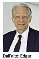
Dall'alto: Edgar Morin e Dominique de Villepin tra gli ospiti attesi

Talleyrand, temibile ministro degli esteri della Repubblica Francese — scrive nella prefazione il direttore dell'Istituto di cultura, Antonio Calbi —, è scoccata una scintilla, ci siamo riconosciuti come fatti della stessa sostanza. (...) Dovevamo realizzare una serata che sarebbe rimasta nella memoria e avremmo dovuto stampare in tempo record il volume che rappresenta un album di famiglia, una bellissima e variegata famiglia allargata, il loro album pubblico che in treccia comunque quello privato».